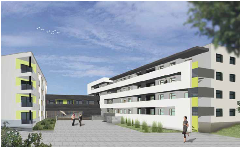
Wohnanlagen nach dem „Bielefelder Modell“