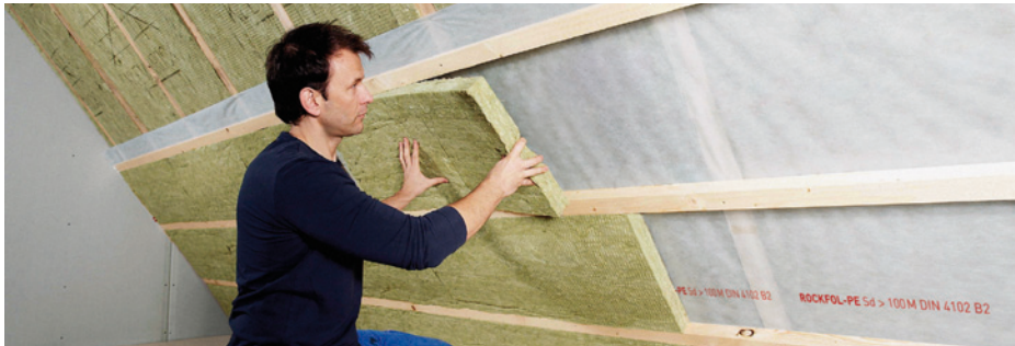
Der Dachraum wird luftdicht verpackt.

Aufgrund der immer höheren Anforderungen an den Wärmeschutz von Gebäuden, entsprechend der Energieeinsparverordnung (EnEV), deren überarbeitete Version seit dem 1. Oktober 2009 gültig ist sowie den Forderungen der DIN V 4108-7 „Wärmeschutz und Energie-Einsparung in Gebäuden“ wird die technische Ausführung der Luftdichtheit zunehmend wichtiger. Denn nicht nur die Gewohnheiten der Wohnungseigentümer und Mieter müssen sich anpassen, sondern auch die bisher praktizierte Raumlüftung. Künftig werden Lüftungsanlagen oder Fenster mit integrierter Raumlüftung auch in Wohngebäuden immer häufiger anzutreffen sein.