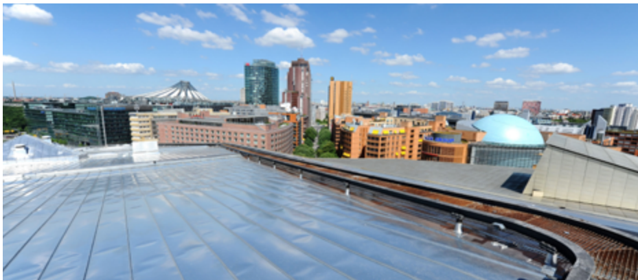
Dach Staatsbibliothek mit Leckageschutz

Zu spät erkannte und nicht lokalisierbare Beschädigungen der Bauwerks- oder Dachabdichtungen sind bis heute die wesentliche Ursache für Schäden an Gebäuden. Obwohl die heutigen Bauprodukte rein werkstofflich gesehen eine hohe Lebensdauer aufweisen, kommt es in Folge frühzeitiger und nicht erkannter Beschädigungen bei vielen Gebäuden zu vorzeitigem Versagen des baulichen Feuchteschutzes. Die Ergebnisse des letzten Bauwerkssicherheitsberichts des Bundesministeriums für Verkehr, Bau und Stadtentwicklung (BMVBS) haben gezeigt: „dass am häufigsten Schäden an der Dachabdichtung von Gebäuden auftraten. Eine erhöhte Schadenshäufigkeit zeigten dabei ... die Dachabdichtungen von Flachdächern.“