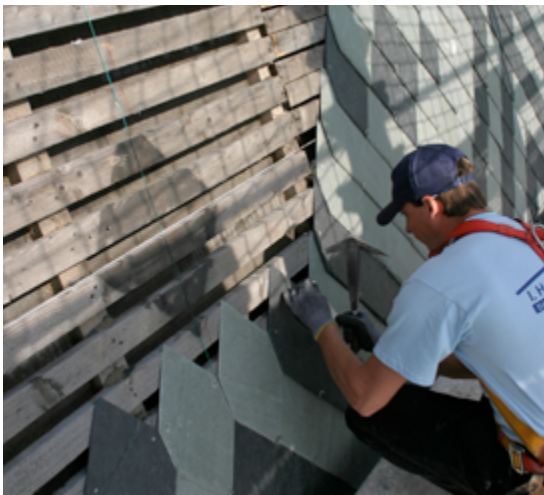
Dachschiefer mit Unterdach

Die Befestigung der Unterdeckbahn auf dem Untergrund erfolgt verdeckt im Bereich der Überlappung. Die Überlappung der Längsnähte und Querstöße der Unterdeckbahn beträgt mindestens 10 cm und wird durchgehend verklebt. Empfohlen wird der Einbau von Nageldichtungen unter der Konterlattung. Darauf verzichtet werden kann bei mehr als 35 Grad Dachneigung, einem positivem Nachweis der Nageldichtheit gemäß ÖNORM B 3647 oder Verwendung von Polymerbitumen-Bahnen, mindestens EKV 20 und mindestens 2,0 mm dick. Generell werden Dichtbänder und Dichtmittel durchgehend angeordnet. Einzelnageldichtungen sind nur zulässig, wenn die Durchnagelung der Konterlattung mit den Lattungs- und Schalungsnägeln mit Sicherheit ausgeschlossen werden kann. Für die Materialien, Mindestanforderungen und konstruktiven Vorgaben gilt die Tabelle 1 der ONR 22219-2.