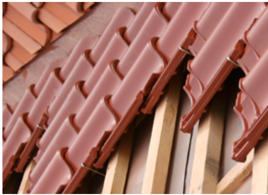
Unterdach mit Konterlattung

Für Wärmedämmungen, die unmittelbar auf der Wasser ableitenden Ebene des Unterdaches verlegt werden – sogenanntes Umkehrdachsystem – dürfen nur feuchtigkeitsunempfindliche Wärmedämmstoffe (Nachweis vom Hersteller verlangen) verwendet werden. Die Konterlatten sind mit zugelassenen, rostresistenten Schrauben oder Nägeln zu befestigen. Die Dichtheit der Konterlattung wird mit Unterdeckbahnen aus Bitumen gesichert. Vermieden werden sollten Verschraubungen oder Nagelungen im Achsenbereich. Das Unterdach wird mit geeigneten Klebebändern oder Gleichwertigem an umlaufendes Mauerwerk luftdicht angeschlossen, sofern keine weitere raumseitige Luftsperrschicht vorhanden ist.