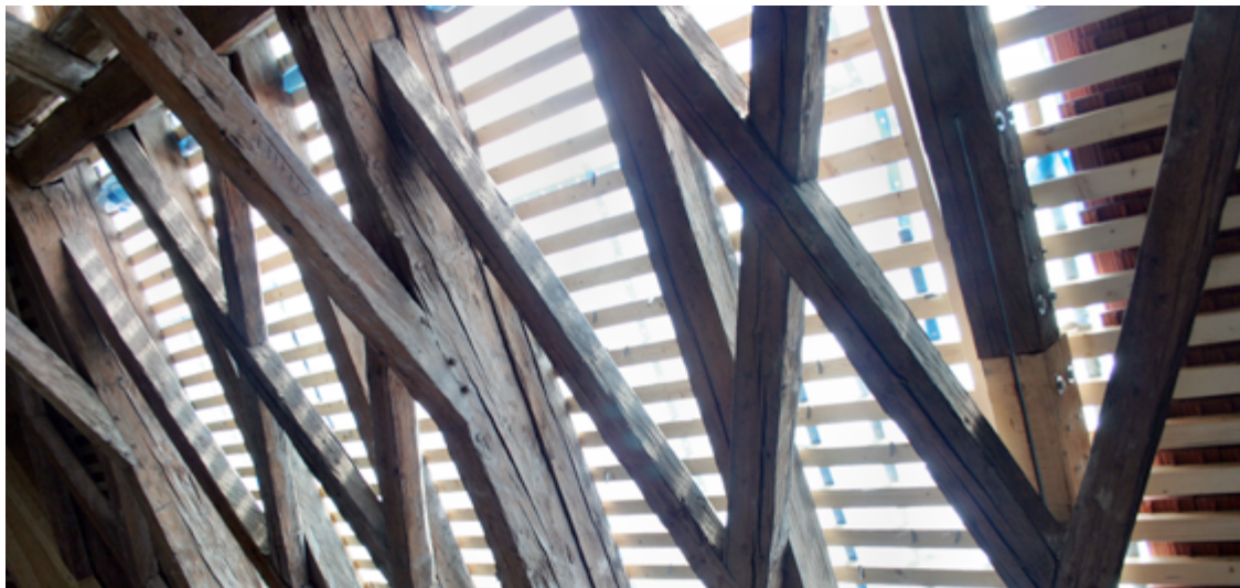
Noteindeckung Dachsparren Untertersicht

Unterdächer sind eigenständige Dichtungs- bzw. Deckungsschichten, die unter der eigentlichen Dachdeckung angeordnet sind. Dabei handelt es sich um Zusatzmaßnahmen, die dazu dienen, bei Unterschreitung der Regeldachneigung die Regensicherheit oder – im besonderen Fall – die Wasserdichtheit einer Dachfläche bei Eindeckung zu gewährleisten. Alle Dächer samt Unterdach werden konstruktiv von verschiedenen Gewerken erstellt: Zimmerer, Dachdecker und Bauspengler. Im Einzelfall kann es bei der Abgrenzung von Haftungsfragen zu Problemen kommen. Beachtet werden müssen auch die gewerkebezogenen Prüf- und Warnpflichten. Die für Österreich gültigen ÖNORMEN B 2219 und B 7219 schreiben bei ausgebauten Dachgeschossen zwingend die Ausführung von Unterdächern vor. In Deutschland gelten dafür die Fachregeln und das Merkblatt des Deutschen Dachdeckerhandwerks (ZVDH).