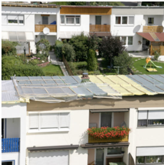
Unterdach mit Konterlattung

Plattenwerkstoffe mit ausgebildeten Nut- und-Feder-Verbindungen dürfen dann als Unterdach eingesetzt werden, wenn sie einer Einzellast von 1,5 kN im ungestörten Feld bzw. 1,0 kN im Plattenstoßbereich standhalten. Werden diese Platten und die Lattungen mit einem maximalen Dachlattenabstand von 40 cm in einem Arbeitsschritt auf der Baustelle bzw. bei Vorfertigung im Werk aufgebracht, dürfen auch Produkte als Unterdach eingesetzt werden, die eine Einzellast von 0,5 kN aufnehmen können. Bei Öffnungen mit mehr als 20 cm x 20 cm (z. B. Dachflächenfenster), sind konstruktiv entsprechende Vorkehrungen (Auswechslungen) vorzunehmen. Es muss im Anschlußbereich eine entsprechende Steifigkeit hergestellt werden, um die Regensicherheit zu gewährleisten. Plattenstöße sind entsprechend der Herstellerrichtlinien mit von diesen freigegebenen Materialien und Verfahren abzudichten. Auf eine Nageldichtung der Konterlattung darf, wenn der Hersteller es erlaubt, verzichtet werden.