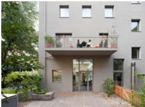
Eingang und Balkone

8. Juli 2010 müssen alle neuen Gebäude in der EU ab 2021 als Niedrigstenergie- oder Passivhaus gebaut werden. Für öffentliche Bauherren gilt dies bereits ab 2019.