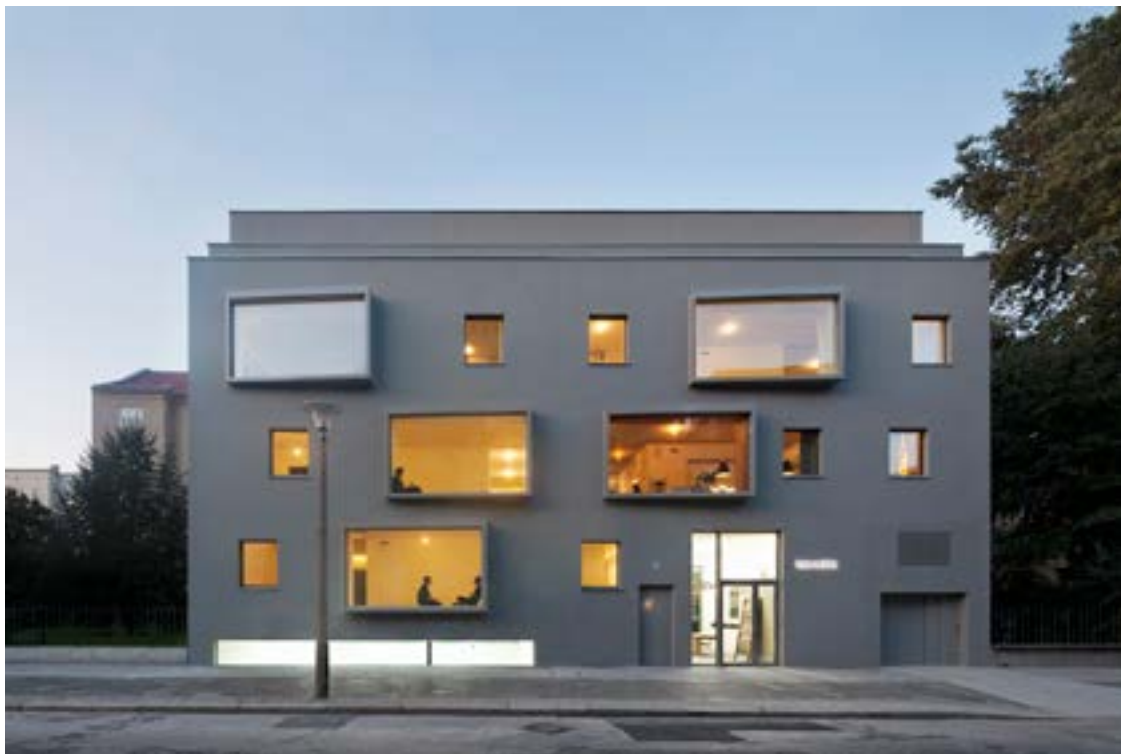
Berlin Linienstrasse

Zwischen Volksbühne und Torstraße, in der Berliner Linienstraße 23, ist ein zeitgenössisch gestaltetes Passivhaus entstanden. Aus seiner steingrauen Fassade springen einzelne Fenster und ein großer Balkon frei hervor. So werden die Formen und Farben der Umgebung locker variiert. Getragen wird der Balkon vom Schöck Isokorb, der als Wärmedämmelement die leichte Linienführung gemäß Passivhausstandard erst ermöglicht.