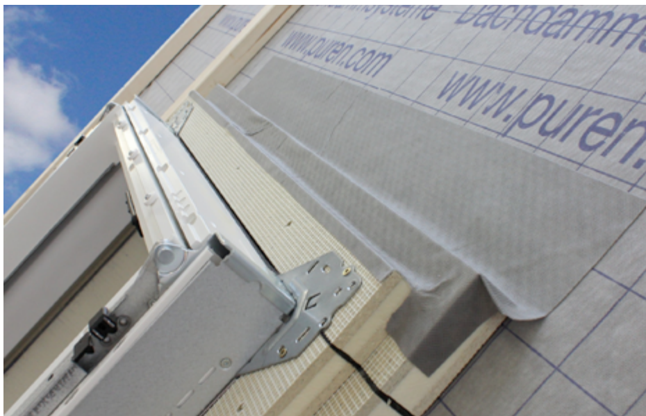
Lüftungstreifen: Fotos Protektor

Der Wert eines Produktes wird bestimmt durch den Nutzen für seinen Anwender. Diesem Motto folgend hat Protektor hochwertige Lüftungsprofile aus Aluminium entwickelt. Das Produkt besteht aus einer speziellen Legierung – dadurch erhält das Material eine optimale Flexibilität bei gleichzeitiger Formstabilität. Das heißt, die Verarbeitung wird erleichtert und die Wellenbildung bei der Befestigung wird verhindert.