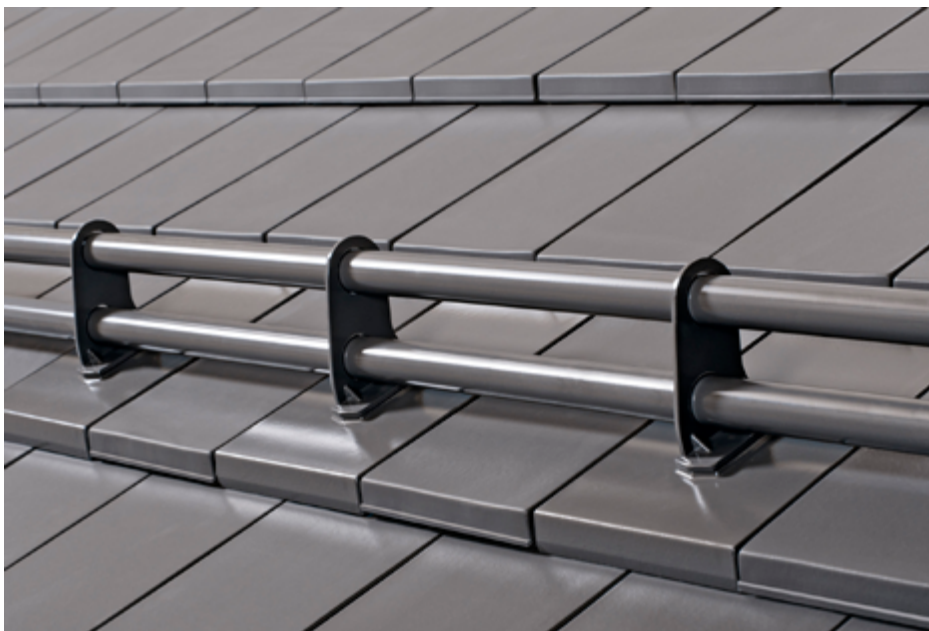
Gebirgsschneefang: alle Fotos Creaton

Das gesamte Dach-System ist nur so gut wie seine einzelnen Teile. Mit ihrem umfangreichen Sortiment an Originalzubehör bietet die CREATON AG von Ortgang zu Ortgang und vom First bis zur Traufe optimal aufeinander abgestimmte Premium-Produkte für sichere, ästhetische und hochwertige Dächer. Verarbeiter und Bauherr erhalten somit optimale Komplettlösungen für eine dauerhafte Sicherheit im System – durchdacht bis ins Detail.