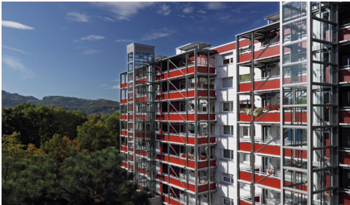
Badenweiler Straße

Nach vier Jahren Modernisierungszeit hat die Freiburger Stadtbau in der Badenweiler Straße in drei Gebäuden insgesamt 224 Zwei- bis Vierzimmerwohnungen auf Neubaustandard modernisiert. Die Arbeiten an den achtgeschossigen Gebäuden aus den 1960er Jahren erfolgten im bewohnten Zustand und wurden in drei Bauabschnitte aufgeteilt. Die Gesamtinvestition liegt bei 23 Mio. Euro. Neben der energetischen Ertüchtigung erhöhte die FSB die Wohnfläche um die Fläche der ehemaligen Laubengänge um 1.200 m 2 auf 16.800 m 2 . Mittels neuer, an der Außenfassade der Gebäude liegender Glasaufzüge, ist heute die barrierefreie Erreichbarkeit der Wohnungen gewährleistet.