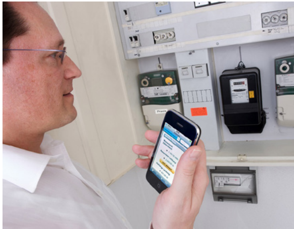
Ablesen per Handy

jeder Liegenschaft. Im besten Fall sind bereits Smart Meter installiert. Ältere Geräte müssen entweder durch ein Smart Meter ersetzt oder mithilfe eines Datenloggers und eines Mobilfunkrouters nachgerüstet werden. Für die sichere und zuverlässige Übertragung der Zählerdaten wird das flächendeckende Mobilfunknetz der Telekom genutzt. Über ein virtuelles privaten Netzwerks (VPN) gewährleistet der Telekommunikationskonzern zudem die sichere Übertragung der Daten.