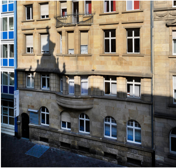
Nutzung Altbau