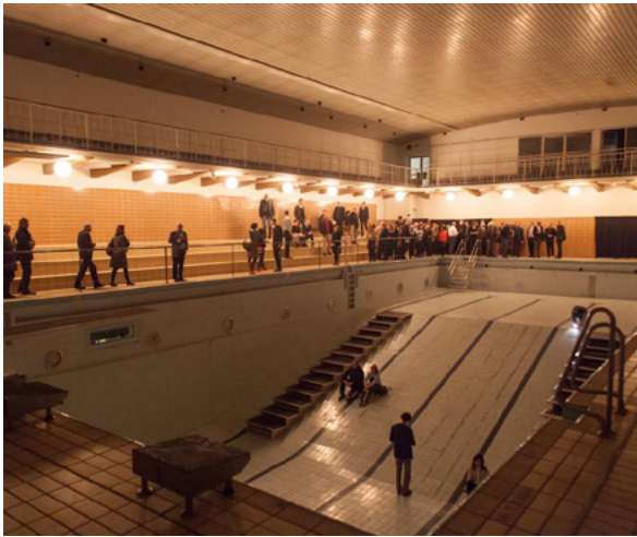
Bundesstiftung Baukultur 2 Stadtbad Schwimmbecken