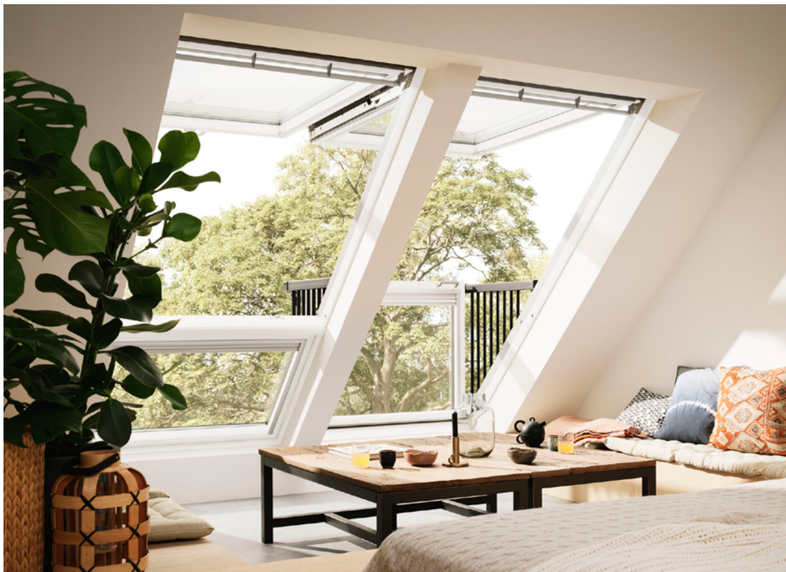
Doppelfenster Cabrio

Mit dem neuen Cabrio Dachfenster schließt Velux die 2012 begonnene Einführung der neuen Fenstergeneration im Bereich Dachfenster ab. Neben den Optimierungen durch die Umstellung auf die aktuelle Generation versprechen die Erweiterung um eine breitere Variante und serienmäßig erhältliche Ausführungen in weißer Lackierung mehr Tageslicht, verbesserte Wärmedämmung und flexiblere Raumgestaltung.