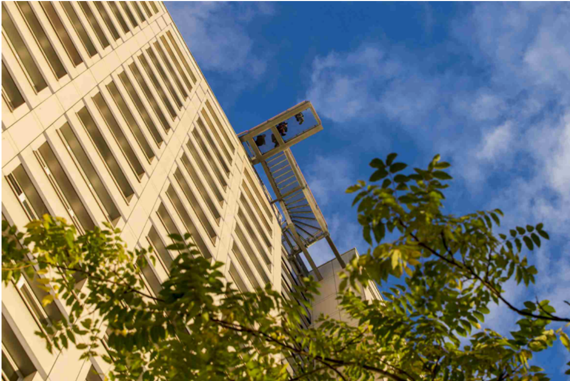
Der Blick vom Eingang nach oben

„Sicher ist, dass Marzahn mit dem neuen Highlight positiv für sich und den Stadtteil werben kann“, so Christian Gräff, Bezirksstadtrat für Wirtschaft und Stadtentwicklung in Marzahn-Hellersdorf. Auch die Marzahner Promenade profitiert vom neuen Angebot: Wer sich demnächst nach oben wagt, kann noch mehr dazu buchen. Auch Führungen durch die Marzahner Promenade mit ihren vielen Kunstwerken werden künftig angeboten.