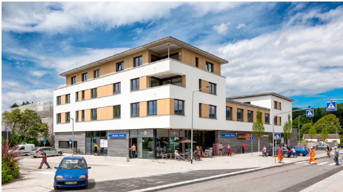
Das prämierte Gebäude.

Um die Baukultur in der Stadt und auf dem Land zu fördern und gleichermaßen das öffentliche Bewusstsein für gute Alltagsarchitektur zu schärfen, zeichnet die Architektenkammer Baden-Württemberg regelmäßig Bauherren und Architekten in den einzelnen Landkreisen und Städten aus. Das Wohn- und Geschäftshaus des Bauverein Breisgau in Stegen für „Beispielhaftes Bauen im Landkreis Breisgau-Hochschwarzwald 2005-2015“ ausgezeichnet. Überreicht wurden Auszeichnung durch Dr. Martin Barth, Stellvertreter der Schirmherrin, Landrätin Dorothea Störr-Ritter. Bauherr und Architekten erhielten Urkunden und eine Plakette für die Anbringung am Gebäude.