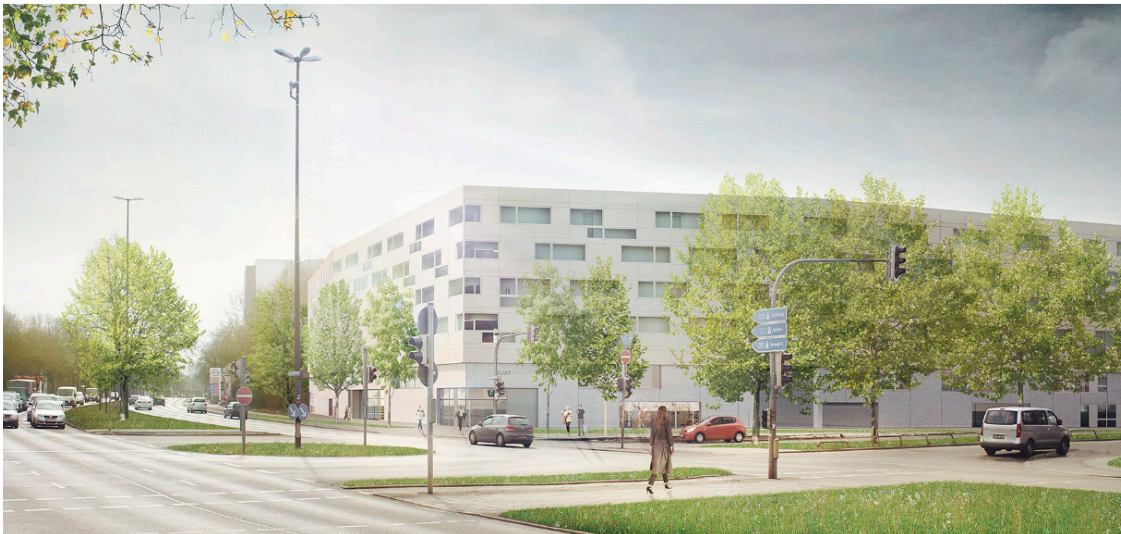
Fassadenansicht vom Innsbrucker Ring aus