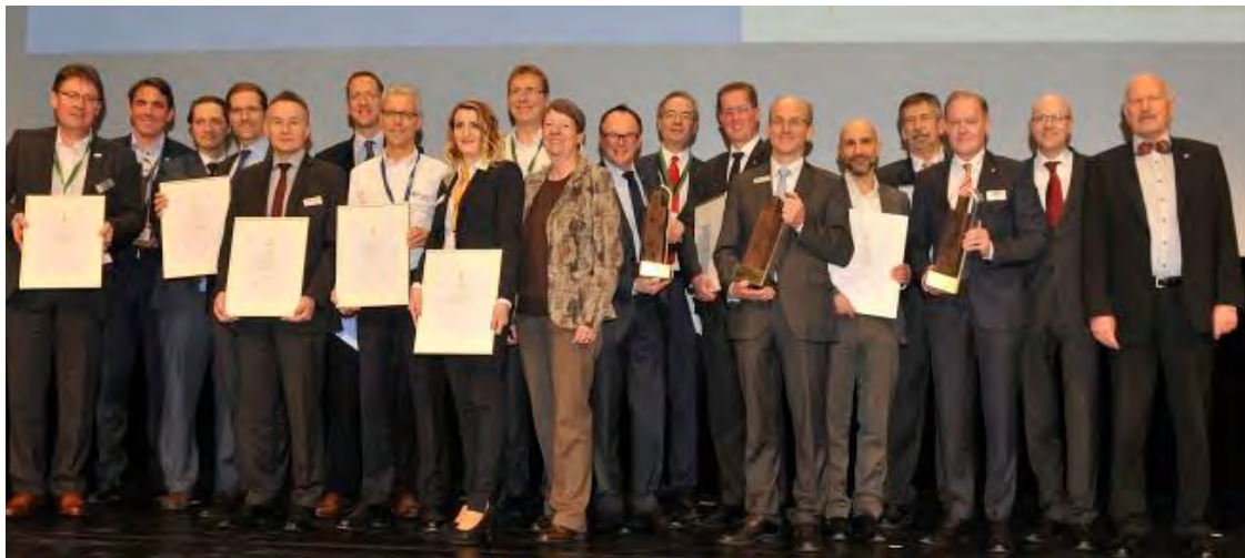
Die Preisträger des BAKA-Awards mit Bauministerin Hendricks.

Der Kongress des Bundesbauministeriums auf der BAU 2017 in München stand unter dem Motto: „Baupolitik ist gefragt - Der Erfolg hängt vom Zusammenwirken aller ab!“ und behandelt aktuelle Fragen zum kostenbewussten und nachhaltigen Bauen. Im Rahmen des Kongresses hat Hendricks als Schirmherrin den Preis für besonders innovative Bauprodukte des Bundesarbeitskreises Altbauerneuerung verliehen.