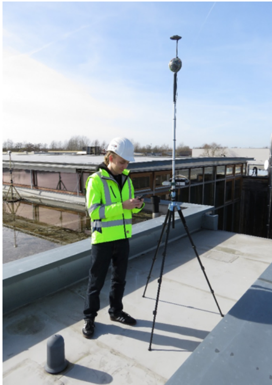
Mittels 360-Grad-Kameratechnik werden auch großflächige Dächer effizient erfasst.

Reale und virtuelle Welt wachsen nun auch im Bereich des Facility Managements zusammen. Nach dem Leitgedanken „Instandhaltung 4.0“ sorgt ein umfangreiches Servicepaket von Solutiance für die digitale Erfassung und Bearbeitung großer Flachdachflächen und erleichtert so Wartungs- und Instandhaltungsaufgaben. Zudem sorgt das System für mehr Transparenz und bietet auch beim effizienten Management mehrerer Immobilien jederzeit einen Überblick über Zustand und notwendige Budgets zur Aufwertung.