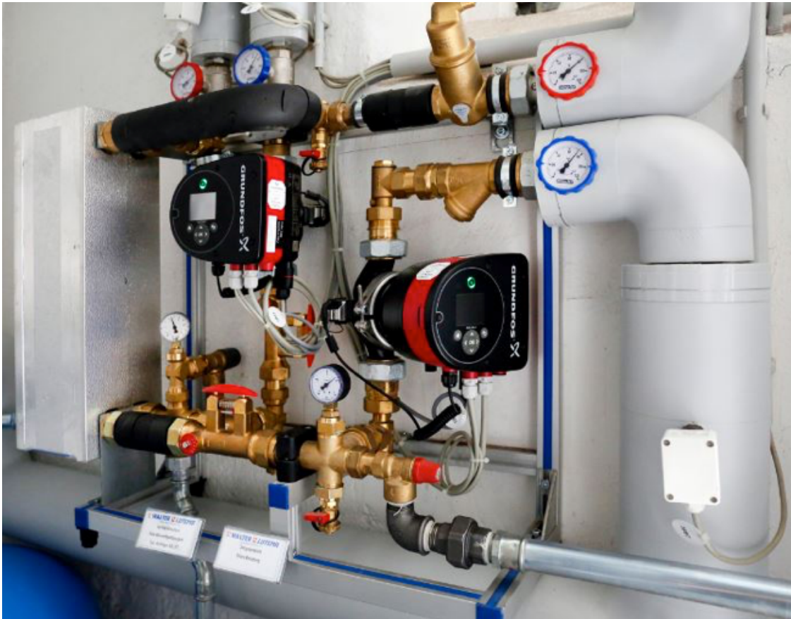
Übergabe Solarwärme, Solarthermie.

Das Wärmemanagement erfolgt über dezentrale Kontrollsysteme und ist so ausgerichtet, dass die Solarwärme sowohl bevorzugt eingespeist als auch dezentral verbraucht wird. Da das BHKW vergleichsweise klein ausgelegt ist, kann es fast ganzjährig unter Volllast betrieben werden. Der dadurch erzeugte Strom wird den Mietern über eine Tochtergesellschaft des Bauvereins für den Eigenverbrauch angeboten und ist dabei einige Cent günstiger als der Öko-Tarif des örtlichen Energieversorgers Badenova. Das Angebot stieß auf großes Interesse: Fast drei Viertel der Mieter haben inzwischen gewechselt.