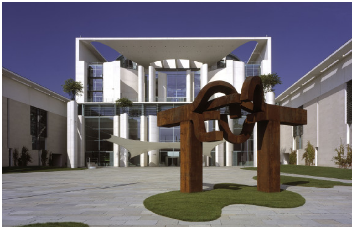
Das Bundeskanzleramt in Berlin.

„Ein guter Anfang für mehr bezahlbaren Wohnraum in Deutschland“, diese überwiegend positive Bilanz zog der Spitzenverband der Wohnungswirtschaft GdW nach dem Wohngipfel der Bundesregierung in Berlin. „Wenn all die Maßnahmen umgesetzt werden, kann Deutschland aus dem Dornröschenschlaf in Sachen mehr bezahlbarer Wohnraum erwachen.“