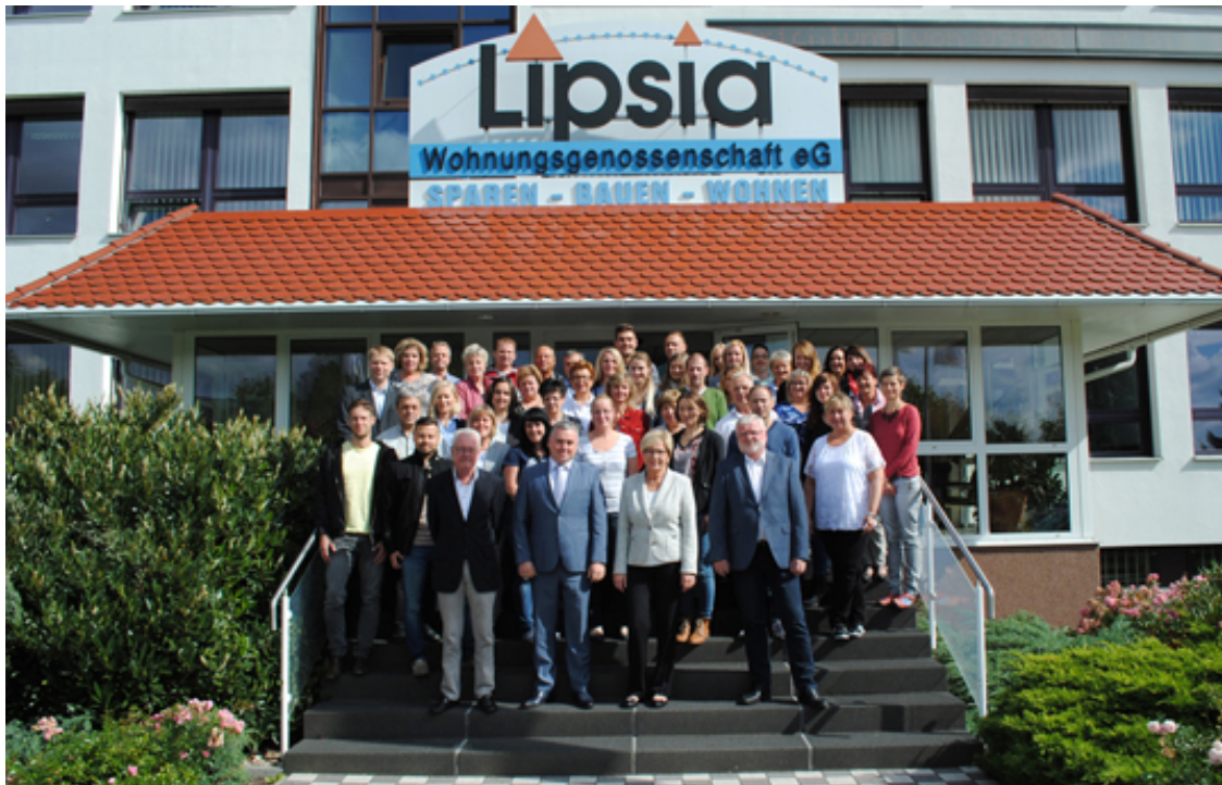
Das Team von Lipsia