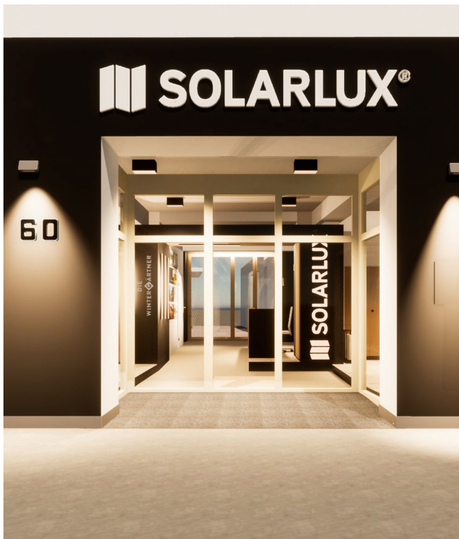
Das Solarlux-Sortiment hautnah in Wien erleben: Der neue Showroom bietet die Möglichkeit dazu.

cherheitsglas (ESG) mit einer Stärke von 10 mm gerecht, das Widerstandsfähigkeit auch bei großen Windlasten garantiert. Trotz hoher Schlagregendichte ist durch einen Lüftungsspalt der Elemente zugleich eine permanente Belüftung gegeben. Kugelgelagerte Zweifach-Horizontallaufwerke mit 65 Kilo Traglast sorgen für ein extrem leichtes Gleiten. Von der Loggia aus sind die wartungsfreien Elemente mühelos zu reinigen.